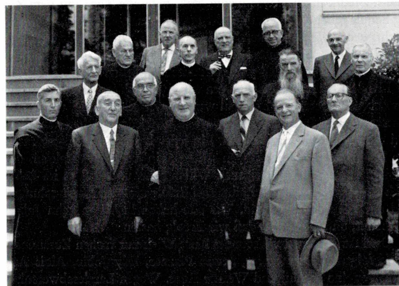
Jubiläumstagung der Maturi von 1909